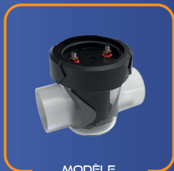
MODÈLE SG 15