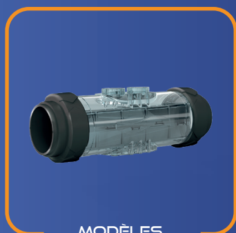
MODÈLES SG 35 & SG 70